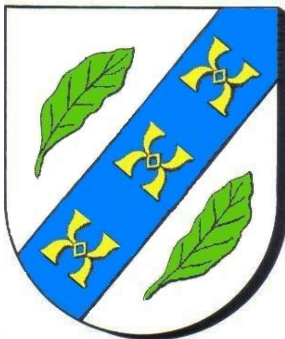
Le blason officiel en couleur

Notice officielle parue dans le bulletin Le Parchemin n° 375